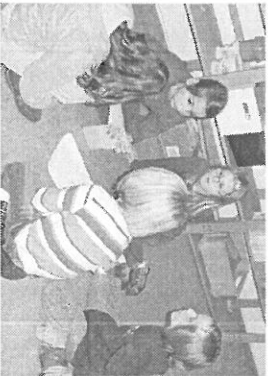
Während des Atelierunterrichts

Uns ist es wichtig, dass jeder von uns lernt und sich darüber seine eigenen Gedanken macht und dadurch stärker wird.