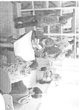
In der Schülerbücherei

Die Weiterentwicklung unserer Schule ist uns wichtig. . . . . Auf der Grundlage gegenseitiger Wertschätzung gestalten wir die kollegiale Teamarbeit. . . . .