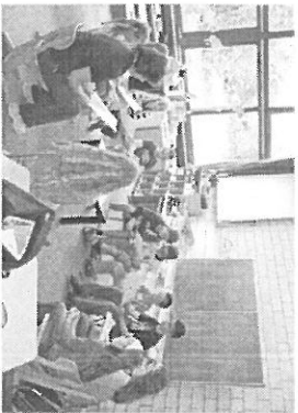
Bei der Streitschlichter-Ausbildung

Bildung und Stärkung des Einzelnen in seiner Gesamtpersönlichkeit stehen bei uns im Mittelpunkt. . . . .